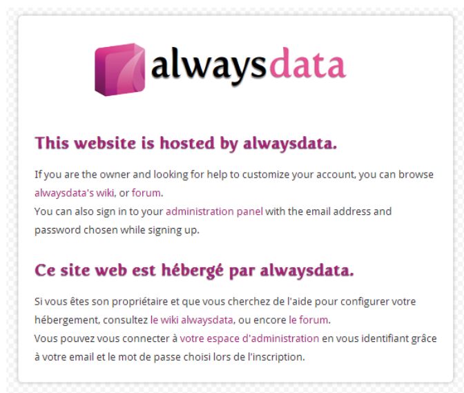
Figure 2 – Page d'accueil par défaut