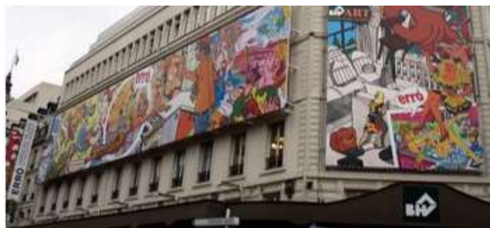
Figure 2 – Fresque de l'artiste Erro

Autre illustration : début juillet 2010, la Mairie de Paris a organisé une grande chasse au trésor dans la capitale. Les participants devaient résoudre des énigmes dissimulées dans cinq arrondissements. Objectif : faire découvrir par cette opération conviviale des aspects méconnus, insolites et historiques de la ville. En début d'année 2010, Sony avait aussi utilisé le principe de la chasse au trésor, dans le cadre d'une campagne multicanale : des places pour un concert d'AC/DC avaient été cachées dans plusieurs grandes villes françaises (Rennes, Nantes, Toulouse, Lille, Strasbourg, Lyon et Bordeaux), à destination des fans les plus motivés et les plus perspicaces pour déchiffrer les indices.