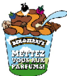
Figure 3 – Ben & Jerry's

Cela fait longtemps que Danette fait appel aux consommateurs pour leur demander de choisir leur parfum préféré. Aujourd'hui, des marques vont plus loin et lancent des concours pour véritablement concevoir de nouveaux produits et packaging.