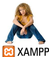
Figure 2 – Logo de XAMPP

Téléchargez et installez le kit d'installation XAMPP 1 comportant notamment un serveur Web Apache HTTP Server , MySQL , PHP et l'application Web phpMyAdmin .