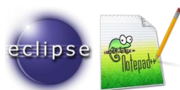
Figure 1 – Logo d'Eclipse et de Notepad++

Veillez à avoir un éditeur PHP dont vous êtes familier (les logiciels Eclipse , Notepad++ , Sublim Text , X-conText , etc. sont disponibles en version portable au besoin).