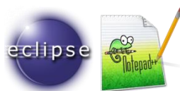
Figure 1 – Logo d'Eclipse et de Notepad++

Veillez à avoir un éditeur PHP dont vous êtes familier (les logiciels Eclipse , Notepad++ , Sublim Text , X-conText , etc. sont disponibles en version portable au besoin).