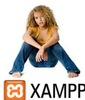
Figure 2 – Logo de XAMPP

Téléchargez et installez le kit d'installation XAMPP 1 comportant notamment un serveur Web Apache HTTP Server , MySQL , PHP et l'application Web phpMyAdmin .