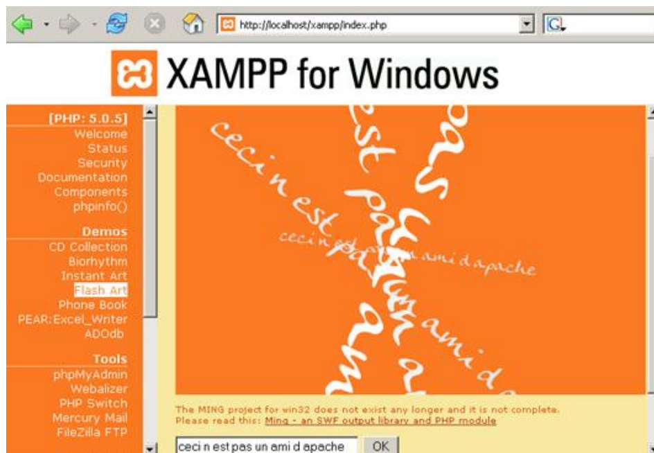
Figure 4 – Démarrage réussi de XAMPP

Testez que l'installation soit un succès : après le démarrage d'Apache HTTP Server, visitez http://localhost ou http://127.0.0.1 (indifféremment) et examinez les exemples et outils XAMPP.