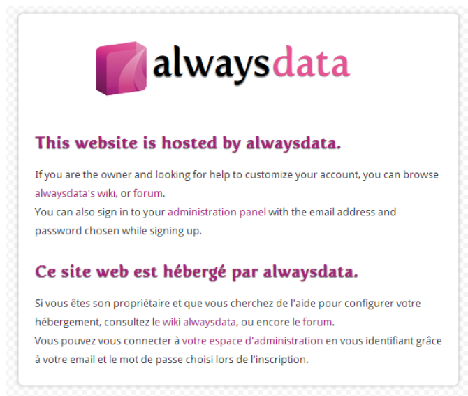
Figure 2 – Page d'accueil par défaut