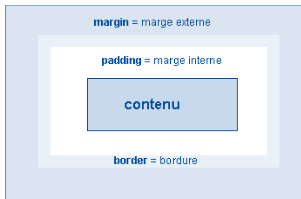
Figure 2 – Margin, padding et border

Mettez une bordure autour d'un paragraphe (généré) de la page Web avec les propriétés CSS border-style , border-width , border-color , etc. Rajoutez-lui également une marge avec les propriétés CSS margin et padding .