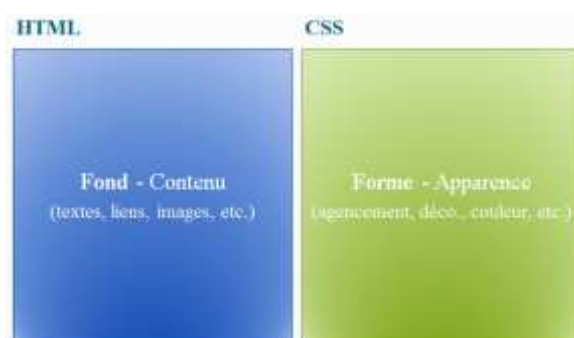
Figure 1 – Fond et forme d'une page Web

Tout le fond (contenu) d'un site Web doit être dans le fichier HTML et toute la mise en forme dans le fichier CSS :