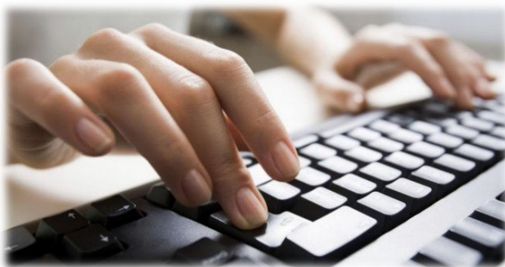
Figure 1 – TD sans souris

Après une période d'adaptation, vous pourriez bien être surpris du temps gagné au lieu de la gêne initialement imaginée.